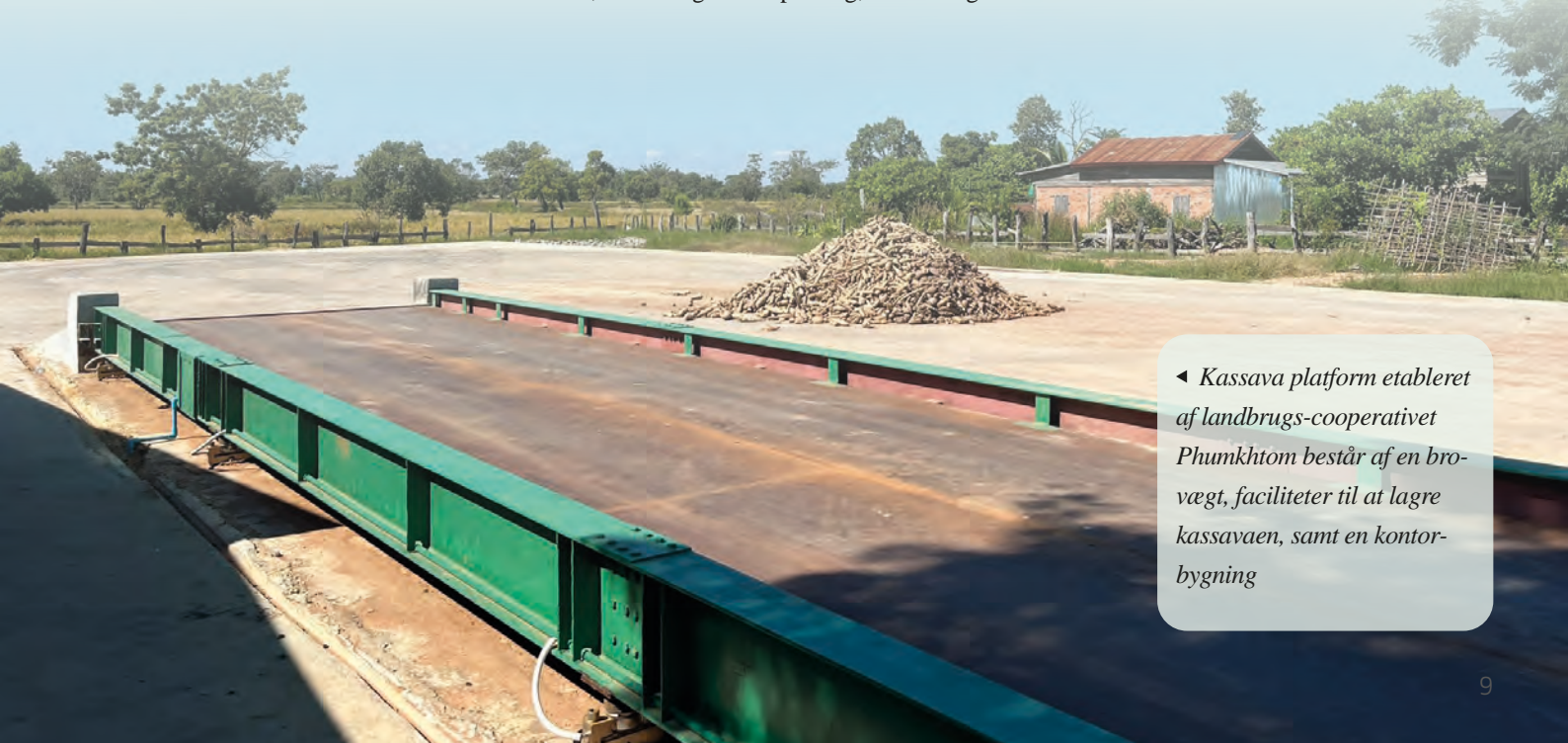
◀ Kassava platform etableret af landbrugs-cooperativet Phumkhtom består af en brovægt, faciliteter til at lagre kassavaen, samt en kontorbygning