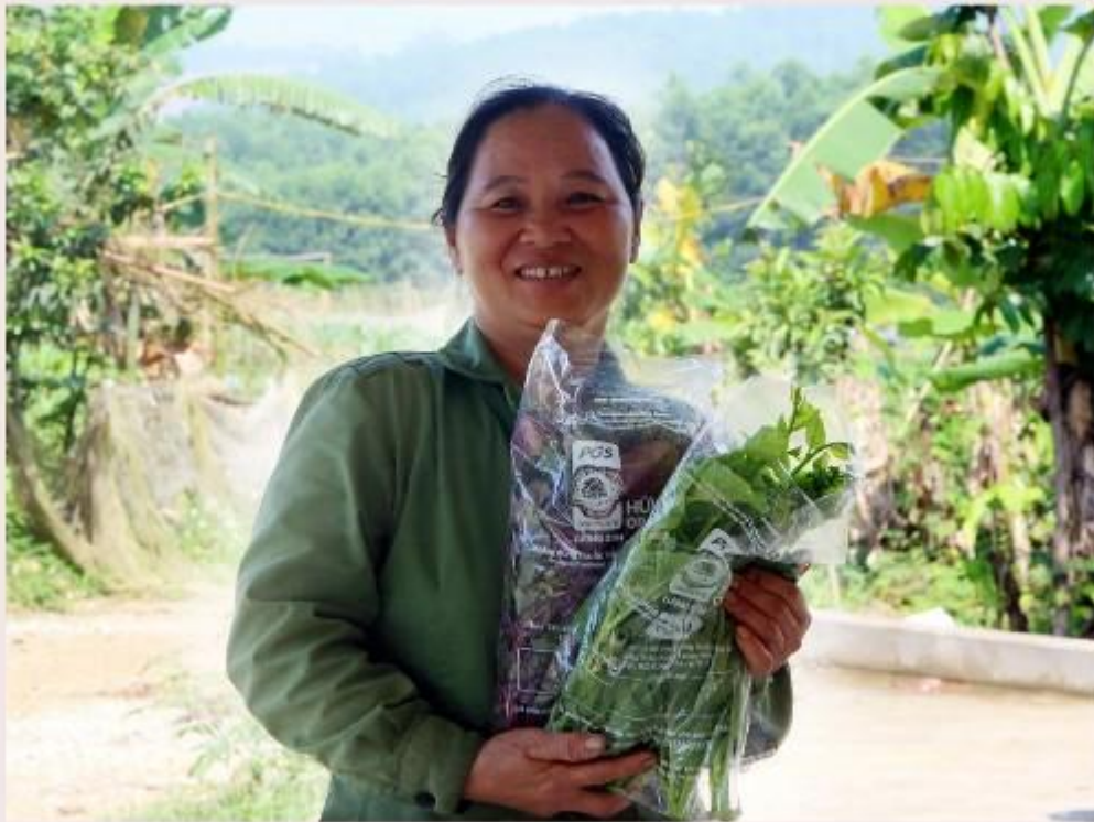
Organic vegetables of the Trai Hoa group are packaged and labeled to PGS standards.

ADDA har igennem Civilsamfund i Udvikling (CISU) fået bevilget penge til formidlingsarbejde i Danmark. Vi har sammensat en flot fotoudstilling, hvor du kan komme og få en visuel læringsoplevelse af landbrugsudvikling i Cambodja, Vietnam og Tanzania.