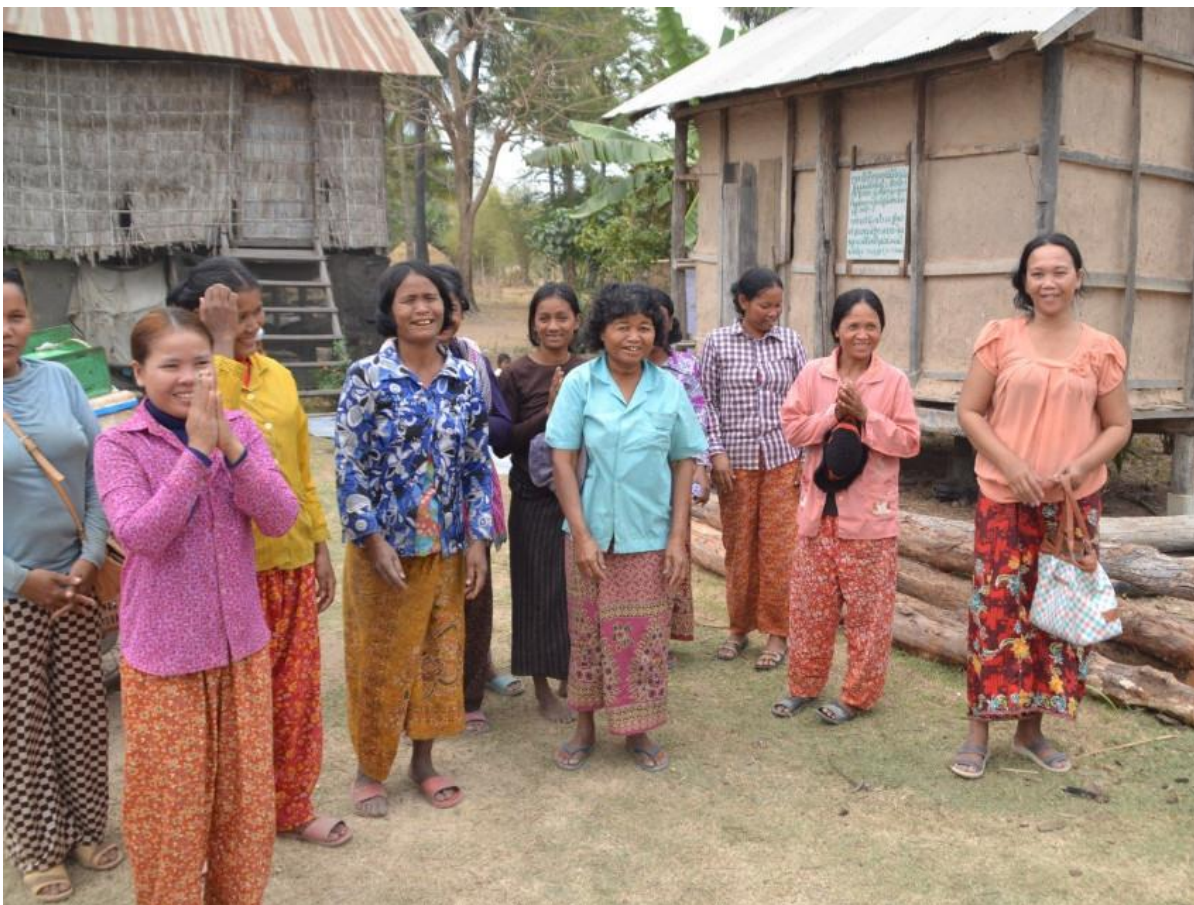
Kvindegruppe i FAHU- projektet foran deres risbank, som de har bygget med hjælp fra ADDAs indsamlinger.

Følg ADDA på facebook og website...klik herunder